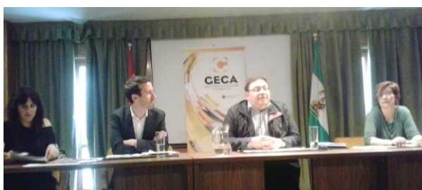
Mesa presidencial con miembros de la GECA