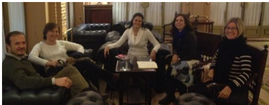
Reunión de trabajo de la Junta Directiva en el Club Labradores de Sevilla en Enero. Comenzamos el año con nuevos proyectos.

La Asociación AMMA sigue trabajando en el ámbito de la investigación y proyectos museológicos. A lo largo del año 2016, ha dirigido sus líneas investigadoras en varias vertientes, destacando la línea de “Accesibilidad y Museos”