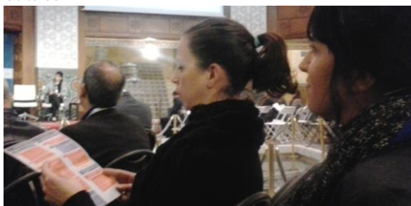
Participación en el Foro de Sol Martín de AMMA