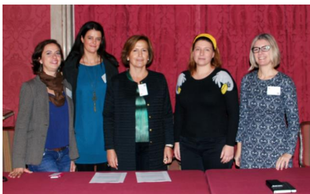
Convenio de colaboración con ACRE, Asociación de Conservadores y Restauradores de España

En el marco del V Encuentro Transfronterizo de Profesionales de Museos, firmamos convenios de colaboración con otras entidades que se habían interesado en el trabajo de AMMA. Esperamos que a lo largo de 2017 vayan dando frutos.