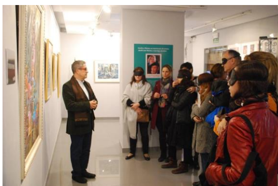
Actividad en el Museo Pintor Amalio sobre accesibilidad

En la Plaza de Doña Elvira comenzamos las actividades programadas para el último día del encuentro: primero la visita a la Fundación Amalio, nada más entrar nos taparon los ojos a la mitad de los asistentes y la otra mitad hizo de lazarillo explicando, además de cómo poder acceder al interior, las piezas que se iban viendo durante la visita. Terminamos en la azotea del edificio experimentando con otros sentidos como el gusto o el olfato.