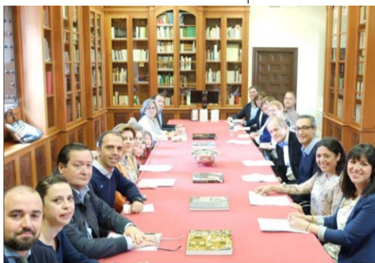
Participación en la lectura de Sol Martín de AMMA

Por invitación de la Asociación De Centros De Enseñanzas De Andalucía - ACEIA participamos en la lectura pública de El Quijote el día del libro. Una bonita experiencia.