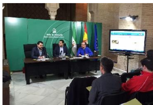
Foro de Profesionales de la difusión del Patrimonio