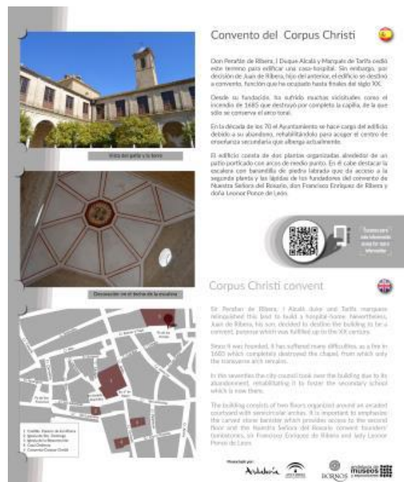
Imagen I. Diseño del soporte informativo ubicado en uno de los monolitos

Para ambas actuaciones se han teniendo en cuenta las características demográficas de los turistas que visitan Andalucía con una motivación cultural -visitante español (59,1%) frente a los visitantes extranjeros (40,9%)- por ello la información ofrecida tanto en los monolitos, como en los paneles informativos ubicados en el Castillo-Palacio de los Riberas, así como en el entorno virtual, se encuentra disponible en español e inglés.