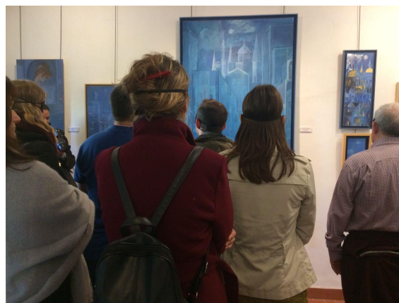
Actividad en el Museo Pintor Amalio sobre accesibilidad