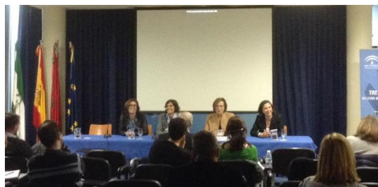
Convenio de colaboración con Acceso Cultura

En la Sesión de clausura del ETPM firmamos un convenio de colaboración con Acceso Cultura, asociación del Algarve que trabaja por la inclusión en la cultura y que pasará a formar parte del proyecto como socio.