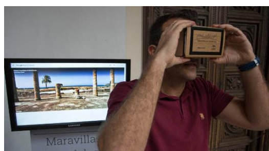
Art camera de Google

La tecnología permite a menudo acercarse a las obras con una minuciosidad que escapa al ojo humano. Hoy, gracias a la Art Camera desarrollada por Google, el usuario de internet puede contemplar con asombroso detalle cerca de 200 cuadros de 11 museos andaluces.