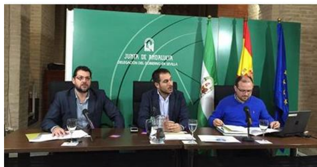
Presentando nuevas acciones en el marco del Carnet Joven Europeo