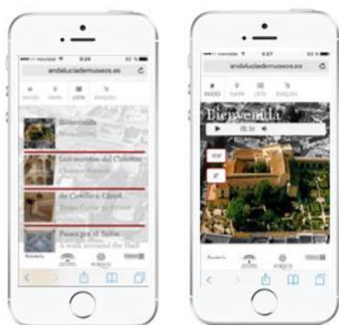
Imagen III. Vista de la website en un dispositivo Apple.