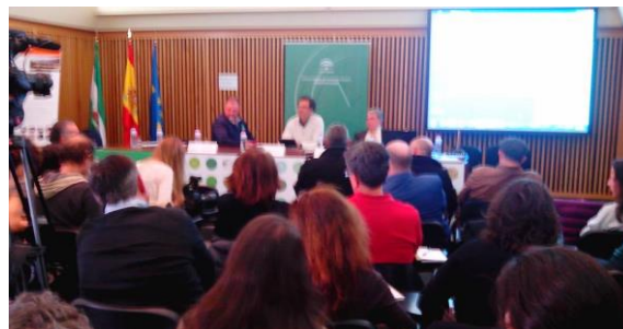
Seminario sobre el Atlas del Patrimonio Inmaterial

En el Atlas del Patrimonio Inmaterial de Andalucía se trabaja en cuatro grandes ámbitos o categorías: rituales festivos, oficios y saberes, modos de expresión y alimentación/cocina.