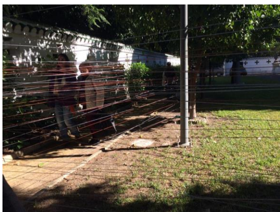
Los asistentes al Encuentro realizan el recorrido propuesto para la actividad de accesibilidad.