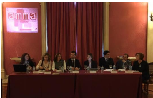
Foto de la Mesa presidencial en la Inauguración del ETPM2016

El ETPM dio comienzo en la sede del Consulado de Portugal a las 09.30 h. Recibimos a los asistentes y ponentes, haciendo entrega de la documentación