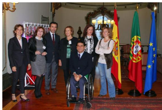
Foto de la organización en el Consulado de Portugal

Dedicamos el apartado de DOSSIER en el presente boletín y constituyendo el quinto volumen especial a “Museos y accesibilidad” , a recoger las ponencias de los especialistas participantes en lo que supone una actividad consolidada en la Asociación de Museólogos y Museógrafos de Andalucía.