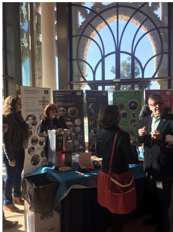
Comida en la Fundación Tres Culturas de Sevilla

técnica al Pabellón de Marruecos de la Expo '92, sede de la fundación, deteniéndonos en aquellos aspectos relacionados con la accesibilidad.