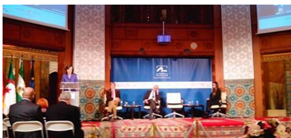
Inauguración del Foro Tanmia en la Fundación Tres Culturas