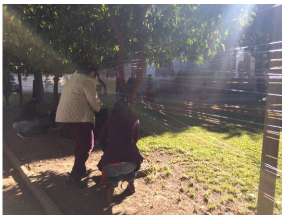
El recorrido ha sido interactivo, animando a los participantes a interactuar con el montaje, en el que se incluían cordones de colores en el jardín del Consulado de Portugal.