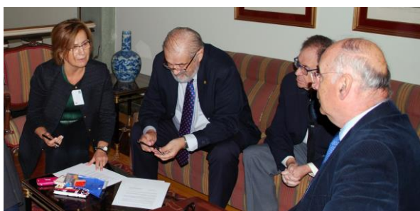
Convenio de colaboración con el Museo Histórico Militar de Sevilla, a través de la cual se ha desarrollado la página: Comunicación de actividades en el Museo Histórico Militar de Sevilla

Esta página se ha desarrollado dentro del Convenio de Colaboración de la Asociación de Amigos del Museo Histórico Militar y AMMA, la Asociación de Museólogos y Museógrafos de Andalucía.