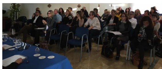
Foto de los participantes y asistentes en la Fundación Tres Culturas de Sevilla