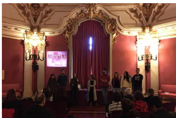
Foto del equipo que presenta las actividades en las que va a hacer partícipes a todos los asistentes del Encuentro

Comenzamos activando el “modo on” para descubrir diferentes formas de mirar, sentir, entender nuestra experiencia volcando nuestras capacidades en nuevas perspectivas.