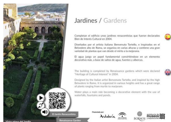
Imagen II. Diseño informativo ubicado en uno de los atriles en el interior del Castillo-Palacio de los Ribera