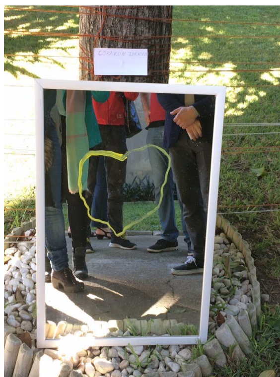
Otro elemento del recorrido han sido diversos espejos situados para que los asistentes tomaran fotos con el reflejo