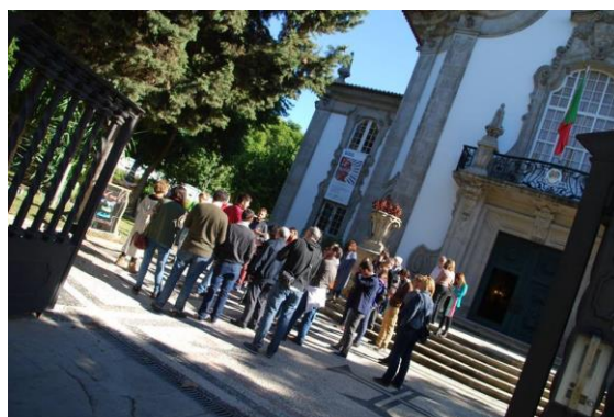
En el exterior del Consulado de Portugal.