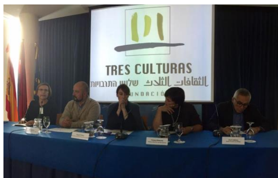
Foto de la Mesa redonda Buenas Prácticas en Museos

La primera Mesa redonda Buenas prácticas en museos :