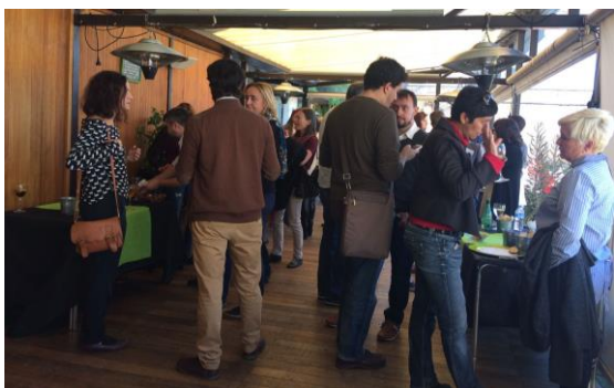
Foto del almuerzo en la Cafetería del CAAC en la Cartuja

Al terminar cogimos la línea C1 de los autobuses de Tussam para trasladarnos a la Isla de la Cartuja, después de un breve paseo por los jardines del Monasterio de la Cartuja entramos en las dependencias del CAAC, donde a las 14.00 h. ofrecimos un cóctel a cargo de la organización para todos los asistentes.