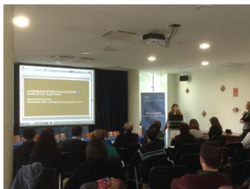
sobre accesibilidad en el Museo Thyssen de Madrid