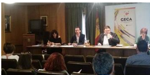
Mesa presidencial con miembros de la GECA

El pasado mes de noviembre hubo una primera sesión de trabajo, desde entonces se ha desarrollado una mesa de trabajo en la que participaron AMMA, AIE (Asociación de Intérpretes del Patrimonio), GECA y el CDL y reconocidos profesionales del sector. Además de las conclusiones se presentó el documento elaborado con el objeto de poner en valor la profesión y ofrecer soluciones reales a las situaciones a las que diariamente nos enfrentamos, la intención es llevar el documento a las distintas provincias de Andalucía.