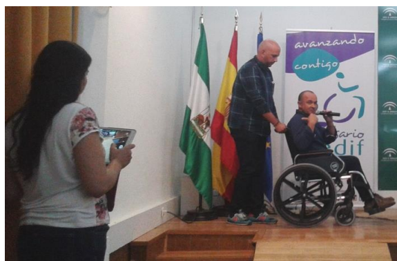
Presentando un supuesto práctico del curso.